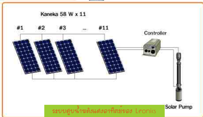
ระบบสูบน้ำติดตั้งแอดอาทิษย์ของ Leonic