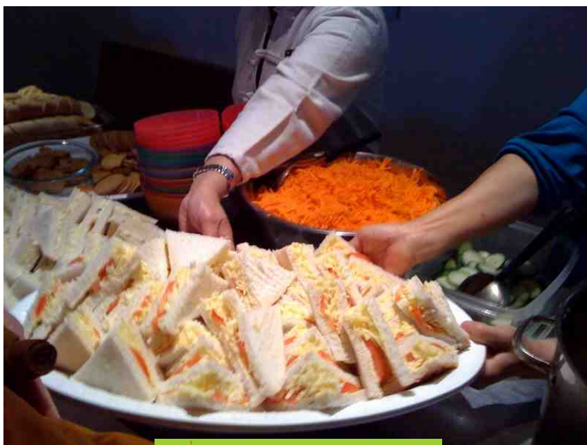
กลุ่มวิงแองดาร์กำลังประมณอาหารพรแส

“อย่า...!” เสียงคนตะโกนมาดังลั่น ในความรู้สึกว่าดังชัดเจนกว่าไมโครโฟน จากเครื่องเสียงอู๊อ้ออของวัดนิดหน่อย