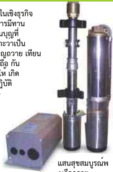
แสงสุขสมบูรณ์ พนคือถวาย

เปล่า ก็คงต้องตอบว่า หากมองในเชิงธุรกิจก็ไม่คุ้ม แต่หากมอง ในเชิงเสริมบารมีทาน ก็เป็นเรื่องของการลงทุนให้เป็นบุญที่คุ้มค่ายิ่งนัก เพราะอะไรหรือ เพราะว่าเป็นธรรมเนียมแต่โบราณมา การทำบุญถวาย เทียน ประทีป โคมไฟ เพื่อให้แสงสว่าง ถูกัน ว่าเป็นการส่งเสริมความสว่าง เพื่อให้ เกิดความสว่างของปัญญา ซึ่งนิยมปฏิบัติกันมาจนเป็นประเพณี เมื่อความเจริญของโลกของสังคมเปลี่ยนไป เทียนและโคมไฟก็กลายเป็น หลอดไฟฟ้า ค่าไฟฟ้า จาก หลอดไฟฟ้าธรรมดา ก็เปลี่ยนไปเป็นหลอดประหยัดไฟเมื่อภาวะโลกร้อนเริ่มส่งผลกระทบต่อมนุษยชาติ ผลกระทบที่จะก้าวไปอีกระดับหนึ่ง แหล่งพลังงาน เพื่อแสงสว่าง ถวายเป็นสังฆทานแก่งสงฆ์