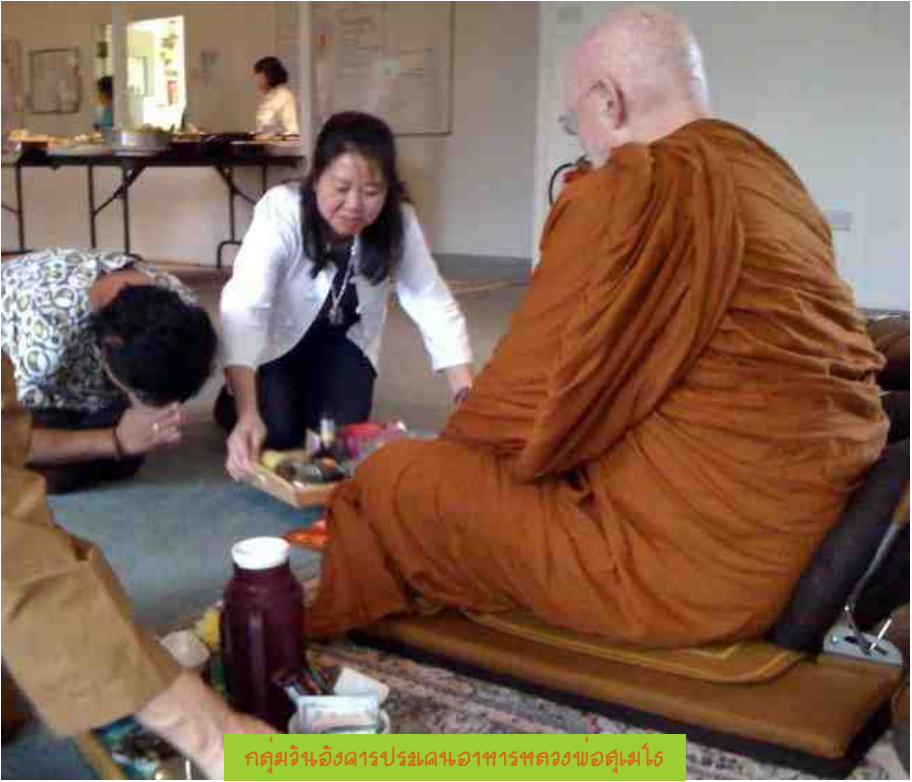
กลุ่มเจ้าเมืองดาปรมณเภาพรทครองพ่อคู่แม่โธ

เป็นพระสงฆ์ เป็นคนวัดคนวา การวางตัวนั้นไม่ง่าย คนเคร่งครัดโดยเฉพาะคนที่เพิ่งเข้าใจธรรมะใหม่ๆ หรือใจรักกลับใจ ก็อยากเห็นพระ เห็นคนวัดเป็น เหมือนในตำราที่เคยอ่านมาในหนังสือ ใจดี มีเมตตา สง่างาม อาจารย์ของเรา การปฏิบัติแบบเรา ถูกต้อง ไปหมด บางคนรู้ตัวว่าพระองค์ไหน เป็นหรือไม่เป็น พระอรหันต์ คนทุกคนมีปัญหา ก็อยากเห็นพระเป็น กันเองเข้าถึงได้