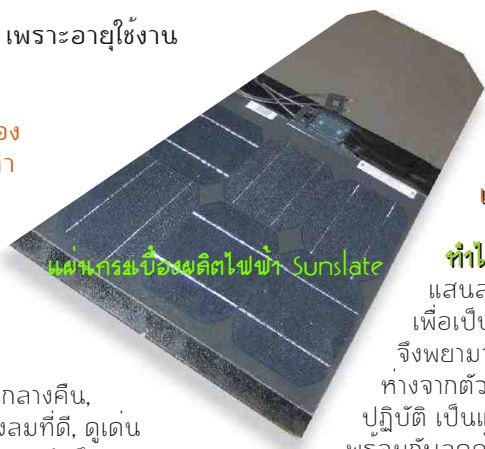
แผ่นกระเบื้องผลิตไฟฟ้า Sunslate

โครงการระยะแรก และระยะที่สอง จะเป็นโครงการ ที่ใช้เพื่อเป็นการศึกษา รวมทั้งเป็นสื่อโฆษณาให้เกิดความมั่นใจว่าโครงการระยะที่สามสามารถทำได้ และได้รับผลคุ้มค่า หากทั้งสามระยะของโครงการนี้สำเร็จ วิสัยทัศน์ก็สำเร็จตามความมุ่งหมาย